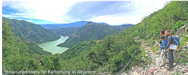
Strukturgeologische Kartierung in Albanien