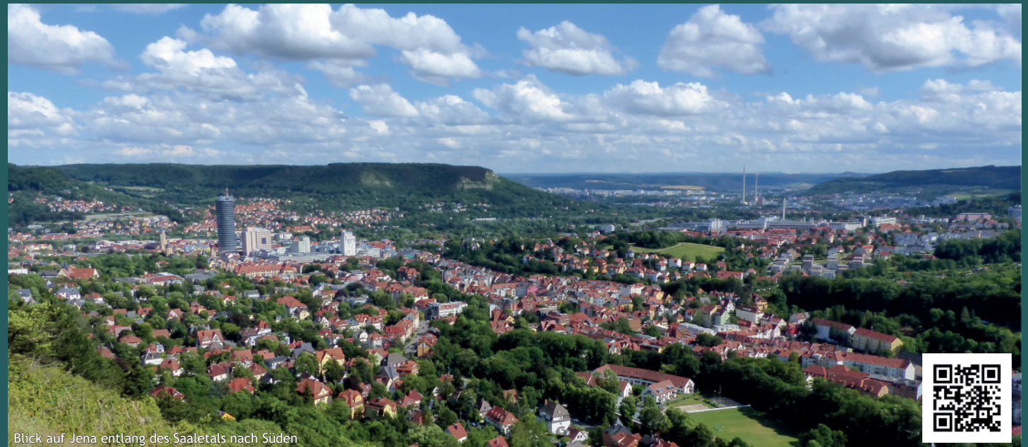
Blick auf Jena entlang des Saaletals nach Süden