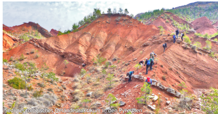
Sedimentologisches Geländepraktikum in den Pyrenäen